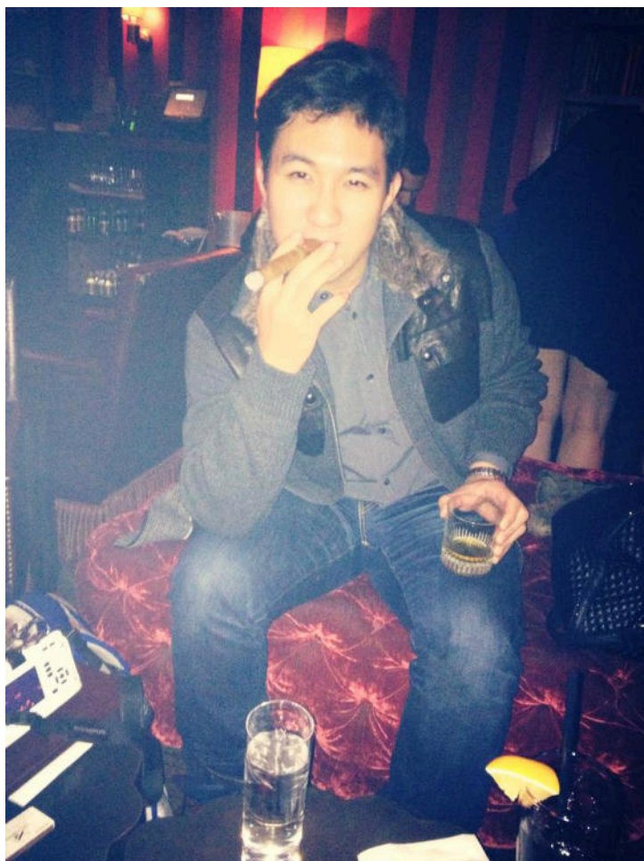
到紐約街頭的紳士酒吧，雪茄、威士忌初體驗