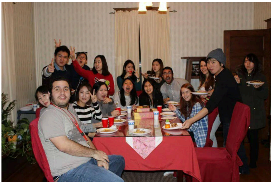
一學期說長不長，說短不短，很快就過去了，上圖是在幫助我很多的教授家準備