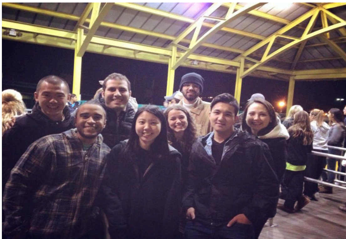
學校派車載我們到最近的大型遊樂園玩，這是我玩過最好玩的雲霄飛車了！