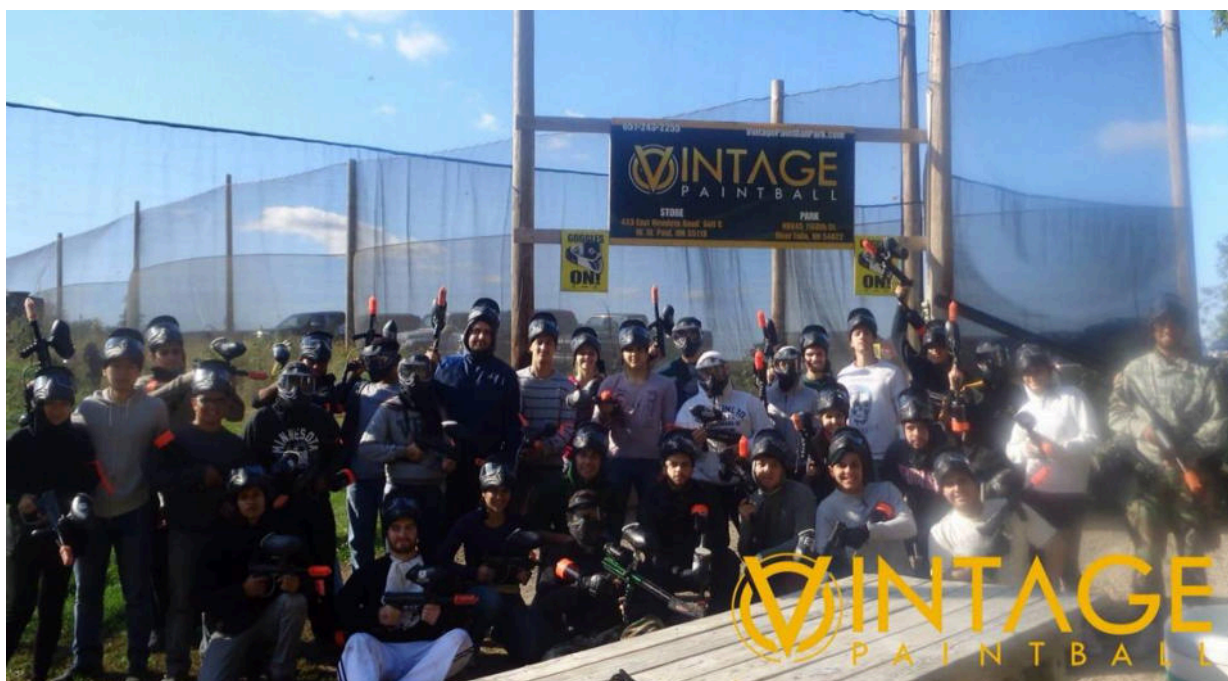
與巴西人打仗，我不小心把朋友屁股射紅了哈哈