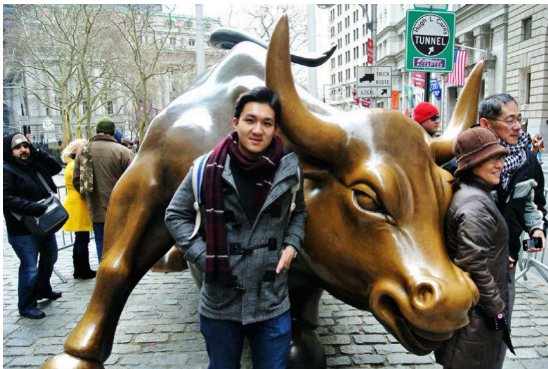
紐約之旅－身為經濟學系的學生一定要來膜拜一下華爾街之牛的阿