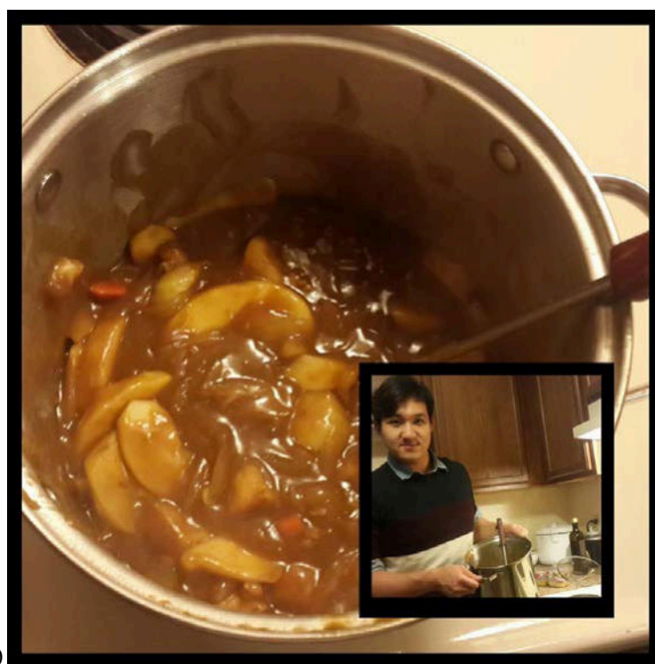
歡送即將離開的我們 Q Q