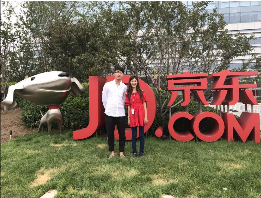
5-8 月實習的地方 與主管一起拍照