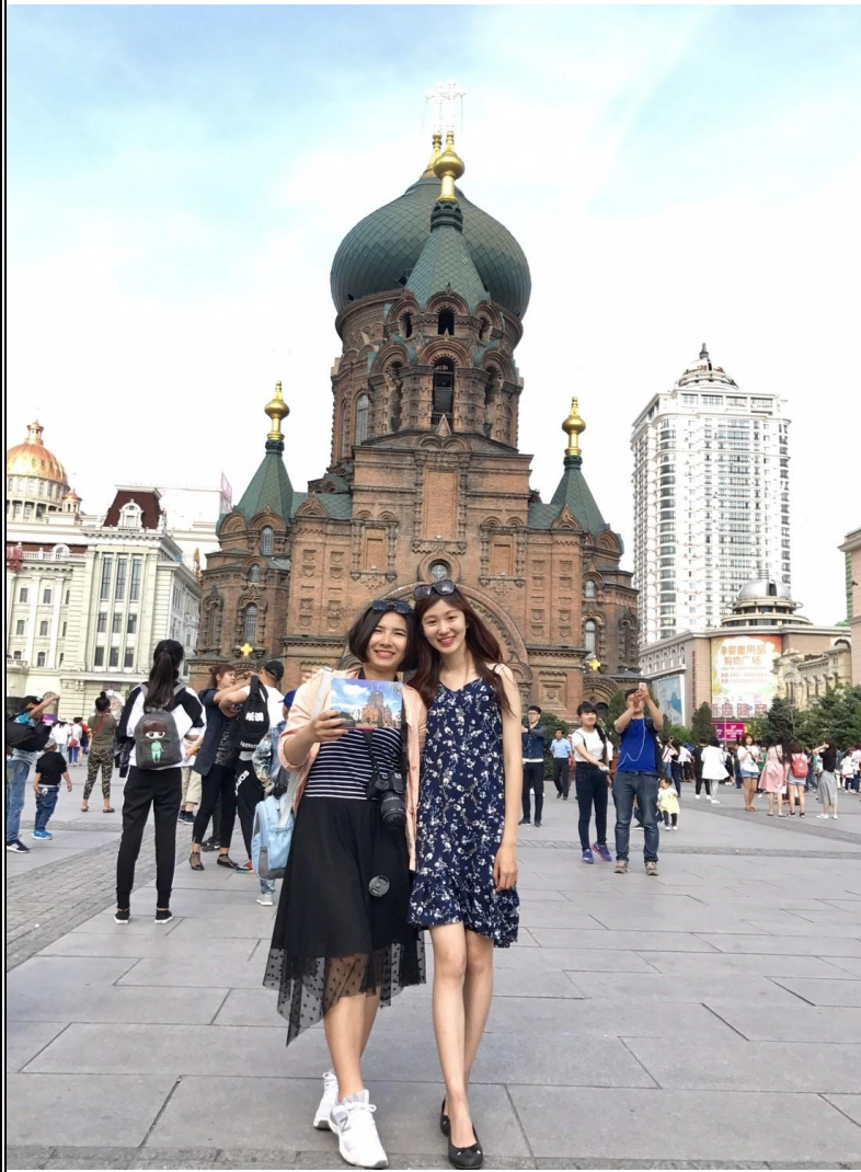
和隔壁房室友一起去哈爾濱