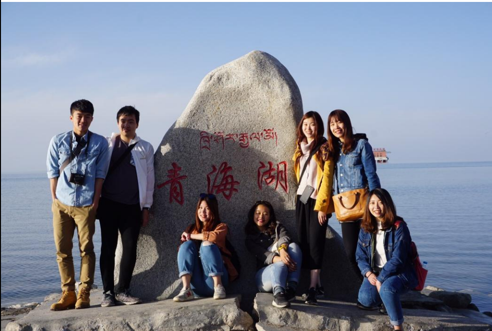
和台灣交換生體驗青海之旅