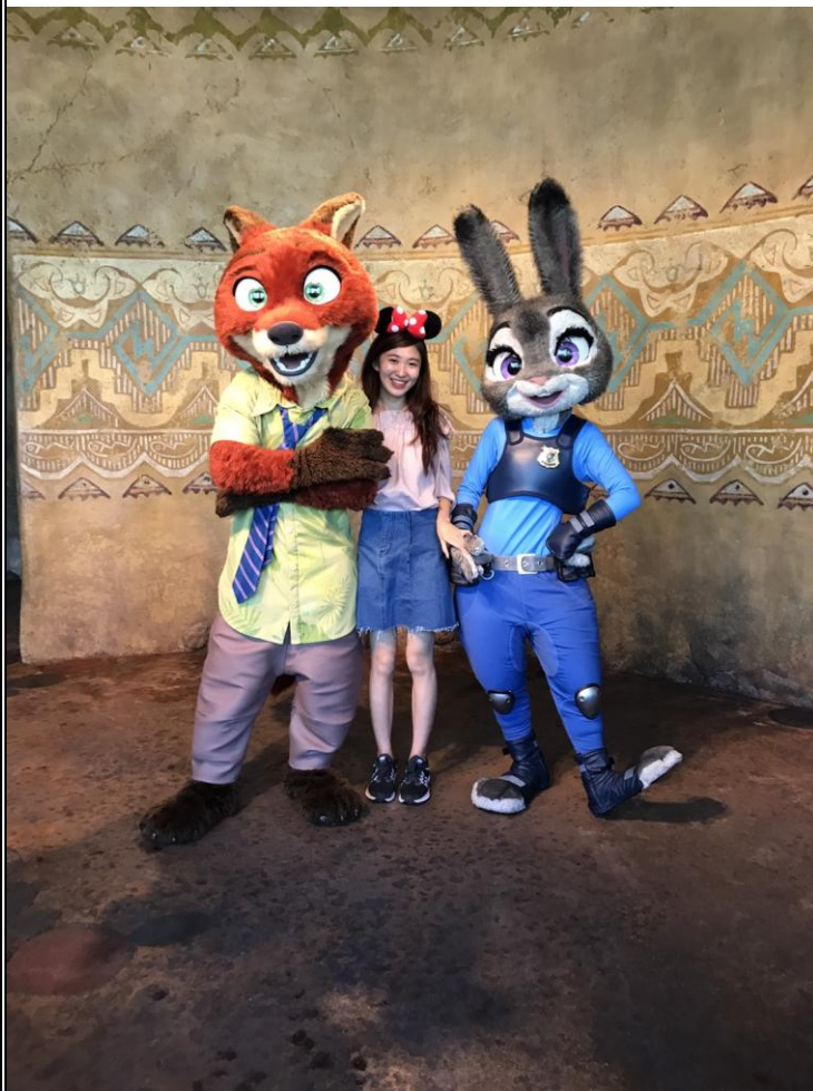
和京東同事一起去上海迪士尼