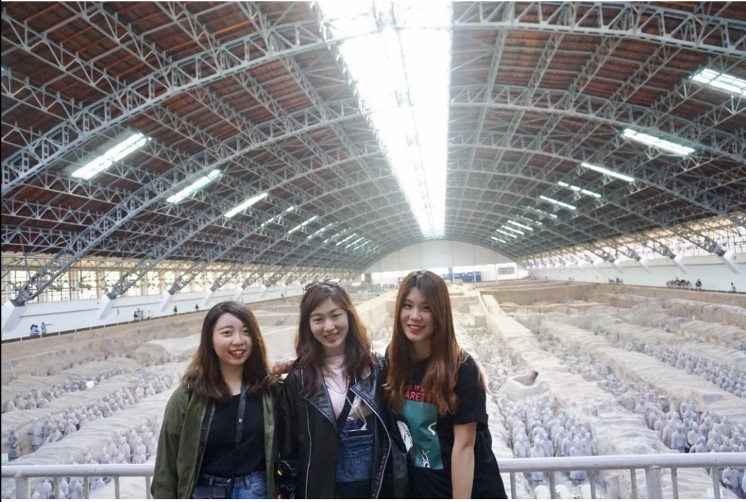
和同寢室友 -西安兵馬俑