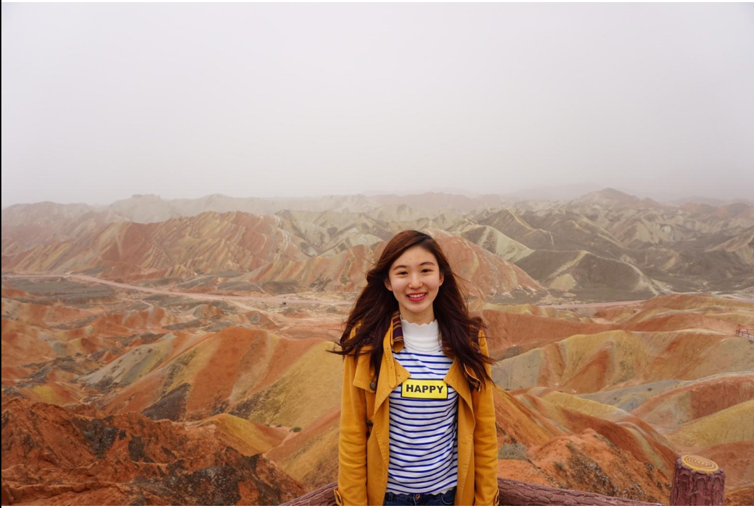
和台灣交換生體驗沙漠之旅