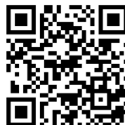
大專法式滾球錦標賽防疫問卷