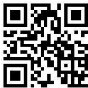
疾管署全球資訊網

十、針對「嚴重特殊傳染性肺炎」(COVID-19)如有任何疑問，可查閱衛生福利部疾病管制署(疾管署)全球資訊網 ( https://www.cdc.gov.tw ) 之專區，或撥打防疫專線：1922 或 0800-001922 (全年無休免付費)洽詢。