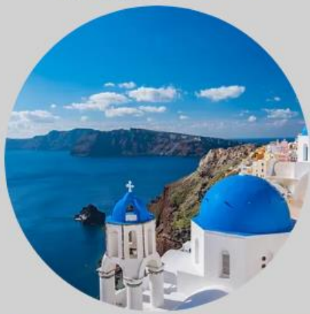
No.2 Santorini (聖托里尼島)

城市中奔馳著拉風的古典老爺車，建築物跟車子都非常的色彩繽紛。漫步於街上的時候，看到當地的人四處演奏著輕快的拉丁音樂並隨之舞動，讓人很自然地擁有著好心情。這件事讓我感受良深。