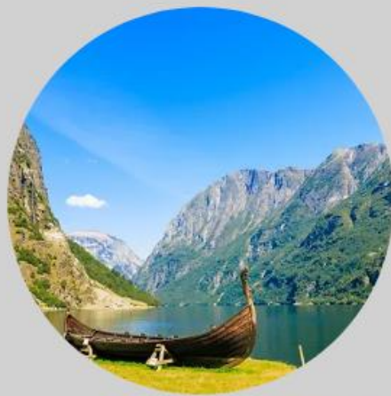
No.1 Norway (挪威)

白色城鎮與蔚藍大海的對比，在耀眼的陽光之下更顯得鮮明，就算什麼都不做，只待在這就讓人心曠神怡。眺望著愛琴海，讓希臘優格更有一番清涼濃厚的風味，好吃極了！