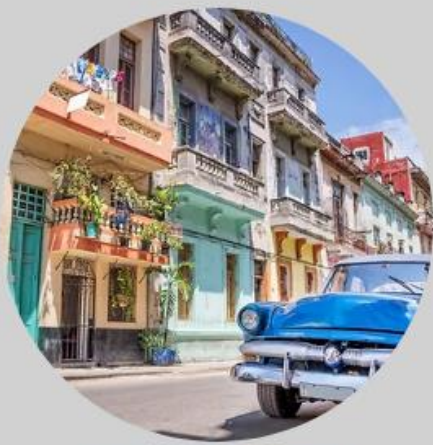
No.3 Cuba (古巴)

城市中奔馳著拉風的古典老爺車，建築物跟車子都非常的色彩繽紛。漫步於街上的時候，看到當地的人四處演奏著輕快的拉丁音樂並隨之舞動，讓人很自然地擁有著好心情。這件事讓我感受良深。